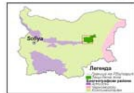
КАРТЕН ЛИСТ 1